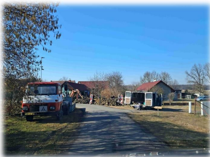
Příprava na nový plot „za KD“