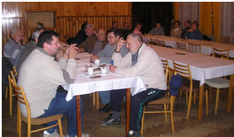
foto z veřejného zastupitelstva, konaného dne 13.12.2007